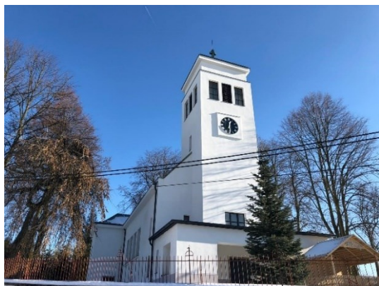
Obrázek 3: Kostel sv. Mikuláše

Kulturní dominantou obce je farní kostel sv. Mikuláše, který se bohužel nedochoval v jeho historické podobě. Kostel sv. Mikuláše se připomíná již ze 14. století jako farní. Fara zanikla za husitských válek a byla obnovena v roce 1891. 20. května 1916 kostel shořel – zničeny byly oba dva zvony ze 16. století. S kostelem tehdy shořely úplně čtyři usedlosti. Kostel byl obnoven v roce 1932. V této nové podobě se kostel dochoval do dnešní doby.