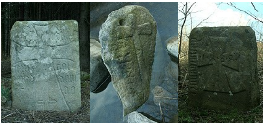
Obrázek 6: Smrčenské křížové kameny

V obci se dále nachází několik míst s křížky, pomníky či sochami. Ve Smrčné, Vilémovských Chaloupkách a místní části Vranov stojí 15 Božích muk. Některé kříže byly pojmenovány podle vlastníků, jejichž pole se nacházela v katastru obce. Dříve se po bohoslužbách v některých oblastech chodilo ke křížům žehnat setbě a prosit o dobrou úrodu.