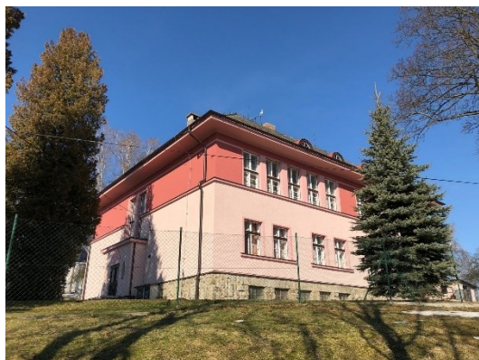
Obrázek 5: Budova české školy