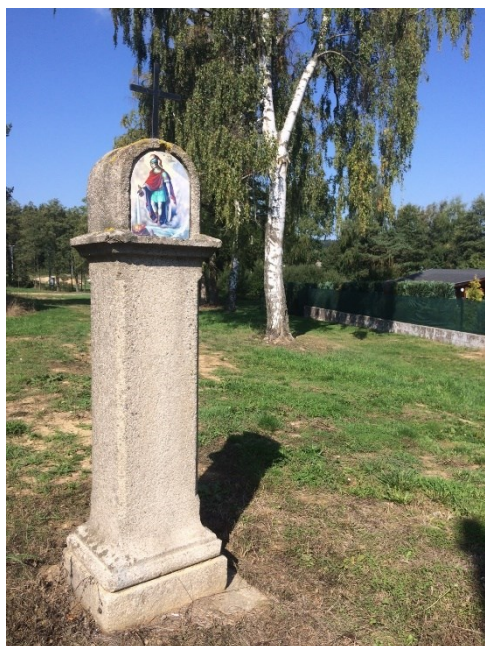
Obrázek 7: Husův kámen ve Smrčné

K boží muce č. 1 se nikoliv náhodou vztahuje neobvyklý lidový název "Husův kámen" užívaný i bývalými německými starousedlíky, který se traduje od dvacátých let 20. století. Tehdy zde několik českých rodin založilo malou kolonii a za posledním domkem se potom rok co rok konaly oslavy svátku upálení Mistra Jana Husa. Vyšňořený průvod českých obyvatel doprovázený hudbou vykročil vždy v podvečer z návsi a došel až k místu konání, kde se u hořícího ohně zpívalo a recitovalo. Bez povšimnutí nemohl zůstat ani kamenný sloup s kaplicí a obrázkem sv. Floriána, který býval při této příležitosti ozdoben a tak se vysloužil ono pojmenování Husův kámen. Jinak vyzývání sv. Floriána, patrona před ohněm, bývalo ve Smrčné vnímáno neobyčejně citlivě, neboť to byl právě oheň, který v popel obrátil několik zdejších selských gruntů a především pak starodávný kostel sv. Mikuláše. Památka který je v evidenci Národního památkového ústavu.