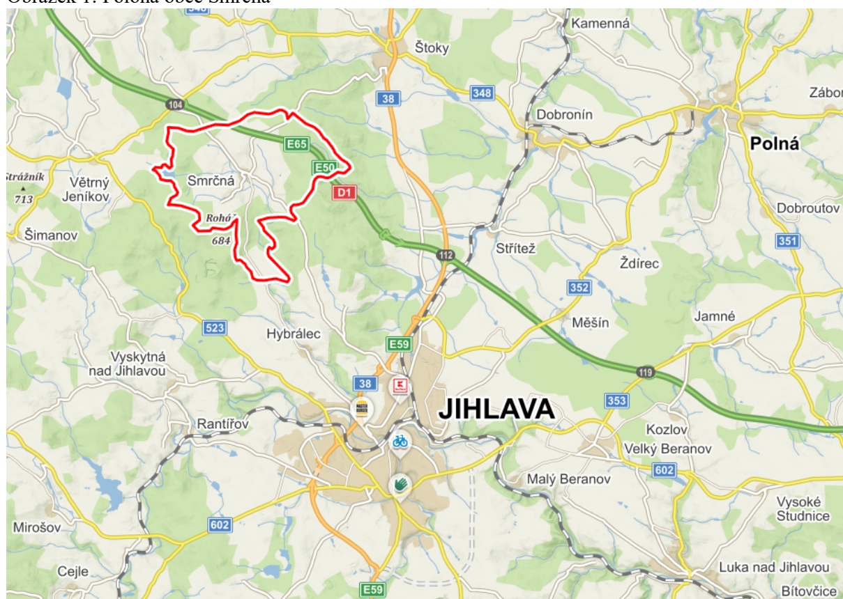
Obrázek 1: Poloha obce Smrčná

Smrčná je obec ležící v okrese Jihlava, kraj Vysočina. Obec spadá pod obec s rozšířenou působností Jihlava. Obec Smrčná leží na katastrálním území Smrčná na Moravě a má tři základní sídelní jednotky – Na Vranově, Smrčná a Vilémovské Chaloupky. Nachází se 6,5 km jihozápadně od Štoků, 12 km severozápadně od Jihlavy, 5,5 km severně od Hybrálce, 5,5 km východně od Větrného Jeníkova a 7 km jihovýchodně od Úsobí. Nadmořská výška je udávána 584 m a rozloha katastru činí 1.236 ha.