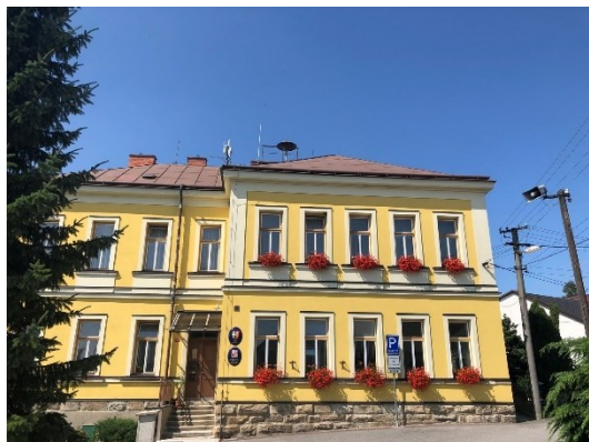
Obrázek 4: Budova bývalé německé školy

Zajímavým historickým dědictvím je také historická budova veřejné německé školy, která byla postavena v roce 1797, která následně v roce 1878 byla přestavěna na novou jednoposchodovou školní budovu. V současné době budova slouží jako sídlo obecního úřadu, je zde také umístěna pošta, knihovna a obecní galerie.