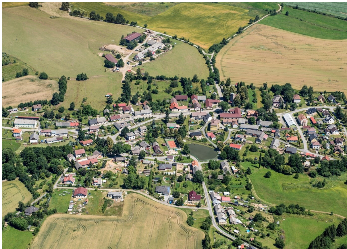
Obrázek 2: Obec Smrčná (letecký pohled)